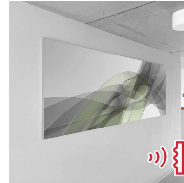
Aluminiumrahmen in SEG-Technik

Diese sind für die spätere Konfektionierung des Akustikstoffes notwendig und werden mitgedruckt.